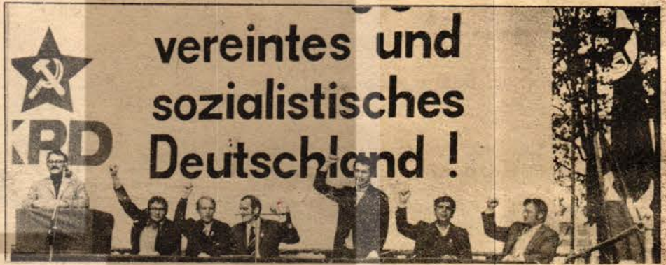
Tribünde ortada ayakta; Türkiye Marksist hareketini temsil eden arkadaşımız