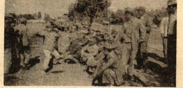
YAS MI BAYRAM MI ? ...

Öte yandan, işçi eylemine kara çalmaya kalkışan ve halkla işçilerin arasını açmaya çalışan İzmir Belediye Başkanı protesto edilmektedir.