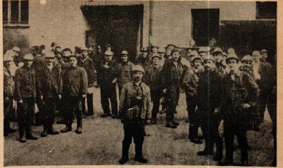
Pülümür Maden İşçileri :