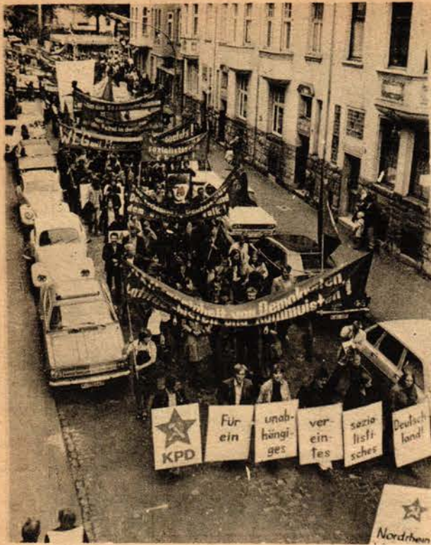
En önde : "Bağımsız, Birleşik Sosyalist Almanya"